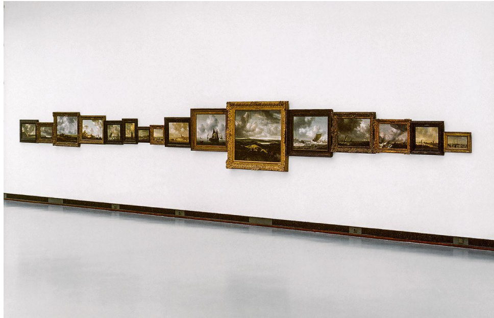
Ger van Elks installatie 'Hollands landschap', in 1999 in Boijmans.

Roosegaarde, die vorige maand in het tv-programma College Tour ook al werd beschuldigd van het pronken met andermans veren, wordt „verdrietig” van de aantijging. Hij zegt het betreffende werk van Van Elk „misschien onbewust” ooit te hebben gezien. „Maar dat doet niet ter zake: deze kunstwerken verschillen sterk.”