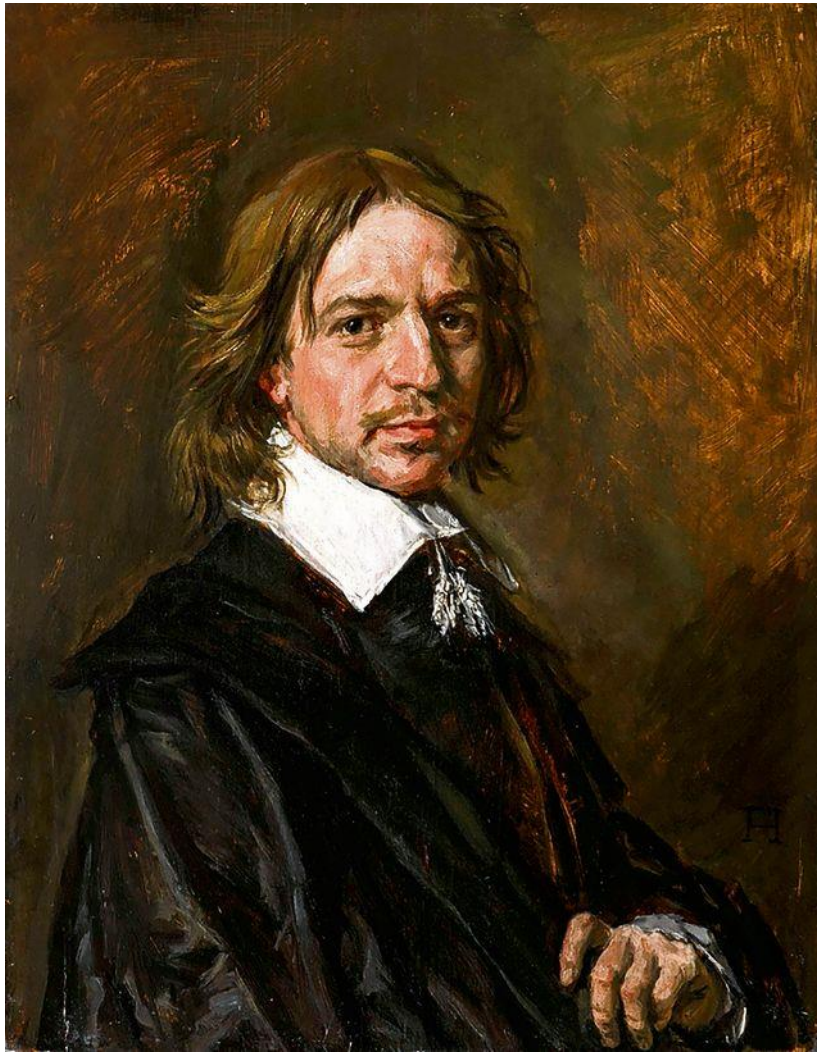
Portret van een Man, niet door Frans Hals