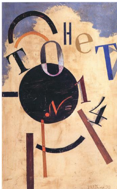
Iwan Puni, Composition

1 January, 2009 – 31 December, 2010 Galerie Samuel 13, rue Portefoin 75003 Paris, France phone: +33 1 42 74 31 05 fax: +33 1 42 74 31 09 www.galerie-phillippe-samuel.com