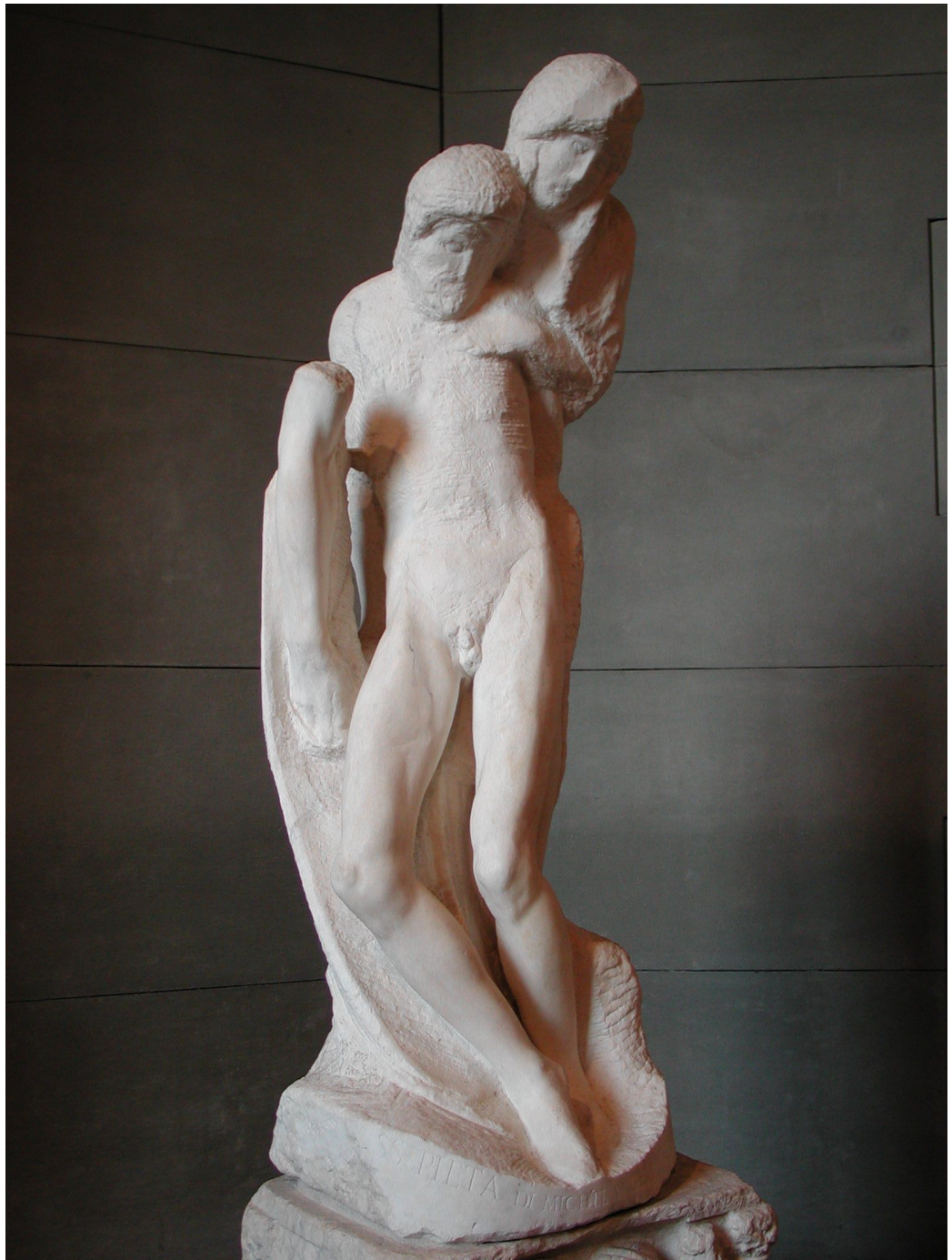
Rondanini Pieta van Michelangelo

Vanwege die onaffe staat leidde Michelangelo's laatste kunstwerk lange tijd een roemloos bestaan op de binnenplaats van het paleis van de Rondanini-familie in Rome. Het werd niet, of uiterst negatief besproken in kunsthistorische verhandelingen. Pas in de vroege twintigste eeuw begon de rehabilitatie van de Rondanini Pietà , en nadat het beeld in 1952 werd verkocht aan de stad Milaan en het terechtkwam in de vaste opstelling van Castello Sforzesco, groeide de reputatie